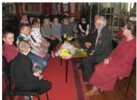
«Настоящий герой». Акция.

Главное направление всех мероприятий, проводимых в музее по патриотическому воспитанию – сохранение преемственности поколений на основе исторической памяти, примеров героического прошлого народа