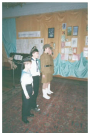
«Муза в солдатской шинели». Вечер.