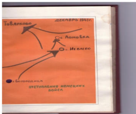
Отступление немецких войск