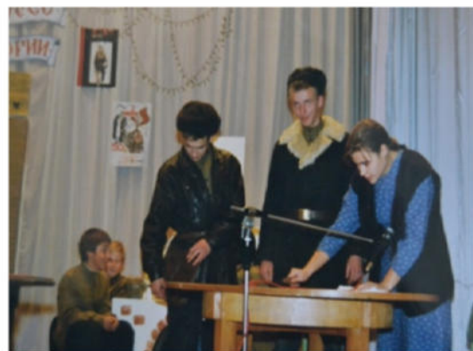
«Нам память болью в сердце отдаёт». Интерактивная театрализованная игра «Колесо истории».