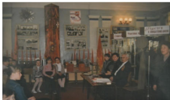
«Поле русской славы». Интерактивная игра-викторина

Главное направление всех мероприятий, проводимых в музее по патриотическому воспитанию – сохранение преемственности поколений на основе исторической памяти, примеров героического прошлого народа