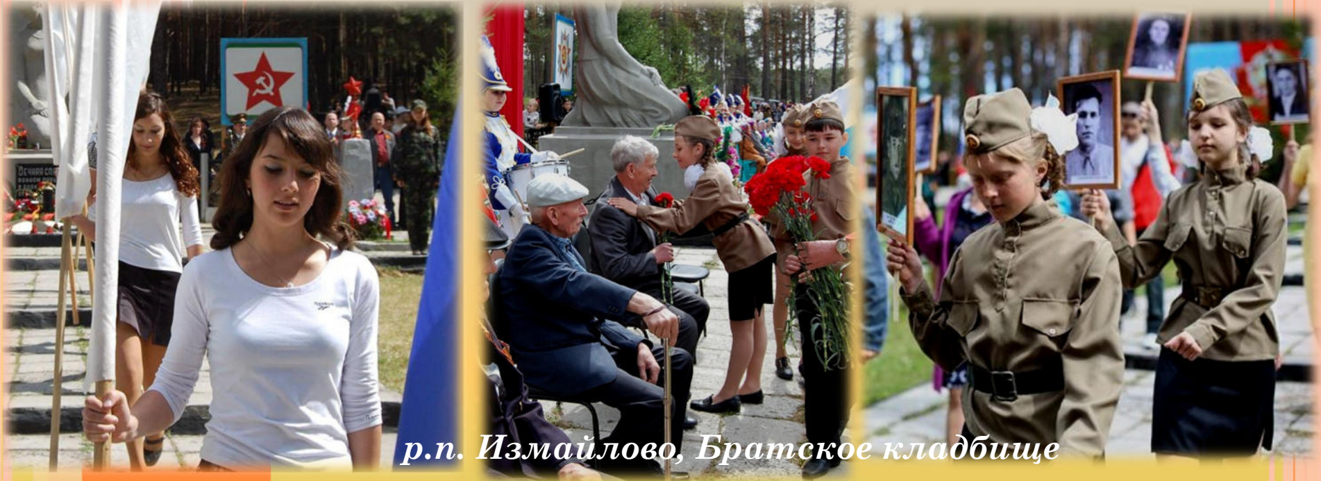
р.п. Измайлово, Братское кладбище