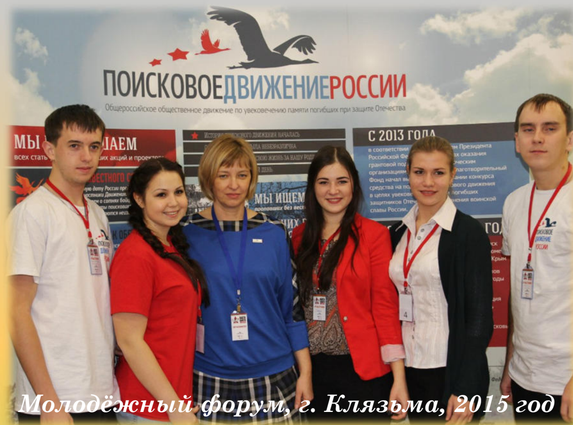
Молодёжный форум, г. Клязьма, 2015 год