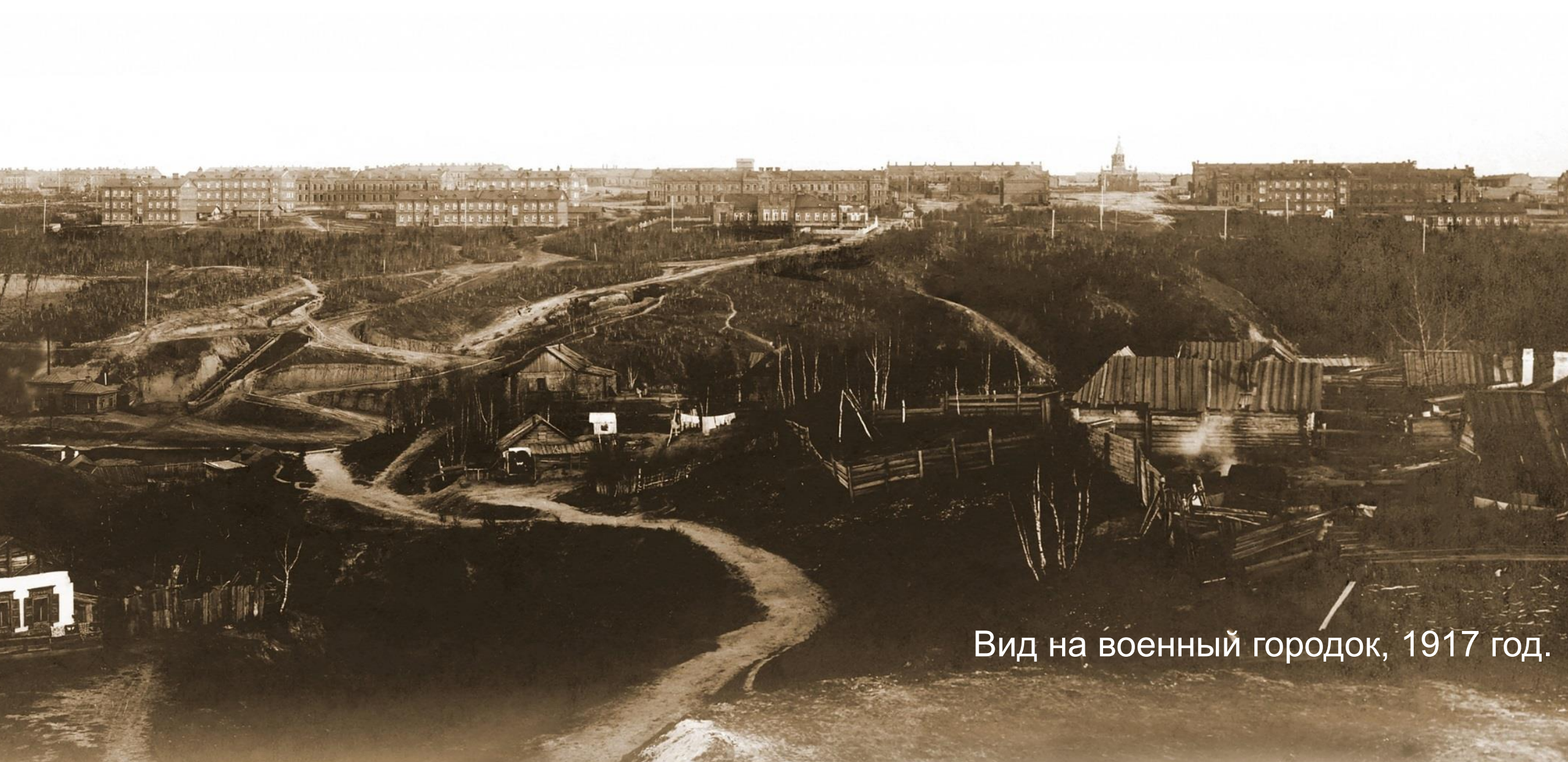
Вид на военный городок, 1917 год.