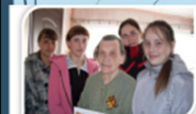
Работа с населением Алексеевского сельского совета

Полученную информацию обработали, классифицировали по категориям: погибшие, пропавшие без вести, вернувшиеся с войны. Вернувшихся с войны классифицировали по пяти поселениям Алексеевского с/совета.