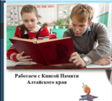
Работаем с Книгой Памяти Алтайского края