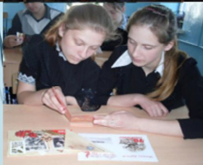
Поисковый отряд «Звезда»