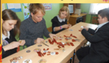
«Я помню! Я горжусь!»