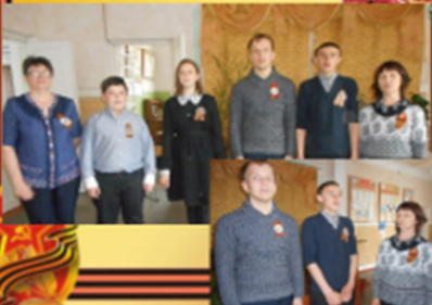
Флэшмоб «Песни военных лет»