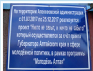
Объявления о реализации проекта