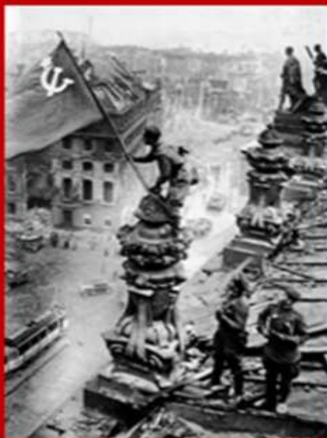
ДЕТИ XXI ВЕКА – ОБ УЧАСТНИКАХ ВТОРОЙ МИРОВОЙ ВОЙНЫ

Хабаровск. Некрасовка. 2015 г. Активация Чтобы акт