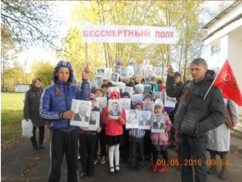
В п из трудилась около года.