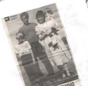
О БОЛЬШЕТЕРЕХИНО И БОЛЬШЕТЕРЕХИНЦАХ

Фотограф запечатлел солдат, стоявшего в очереди, ожидая очереди на завтрак. Это фото было найдено в архиве музея. Оно относится к началу войны в старом здании школы. В архиве музея сохранились также другие фотографии того периода. В частности, до 1937 года в школе обучались и проживали члены бригады «Красная Армия». В 1937 году в школу переехали из села. В середине 1930-х годов в школе работали учителя и преподаватели. В 1937 году в школе работали учителя и преподаватели.