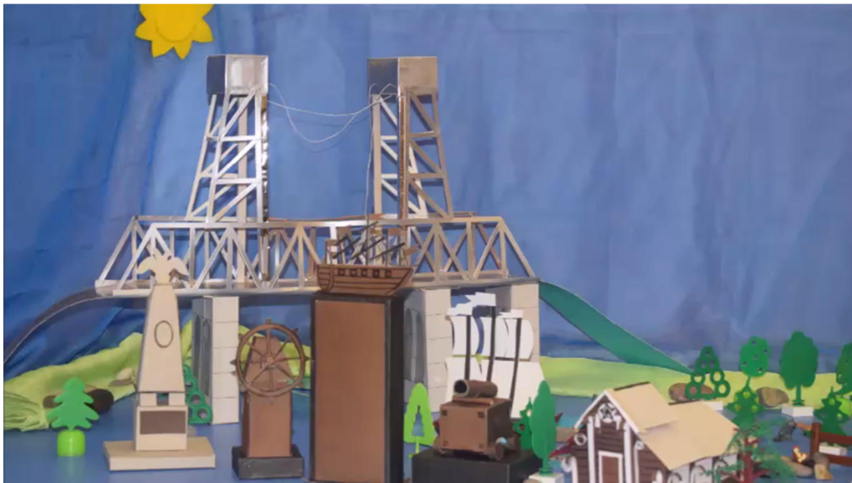
Голубева Е.Н. 2020 г.